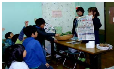
辻堂青少年会館ワークショップ「紙の不思議」